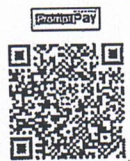
ร่วมทำบุญเข้าบัญชี