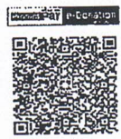
ร่วมทำบุญผ่านระบบ E - Donation